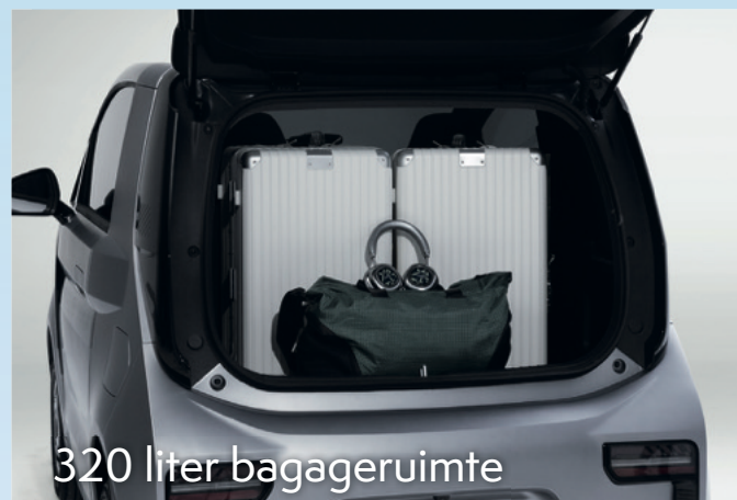
320 liter bagageruimte