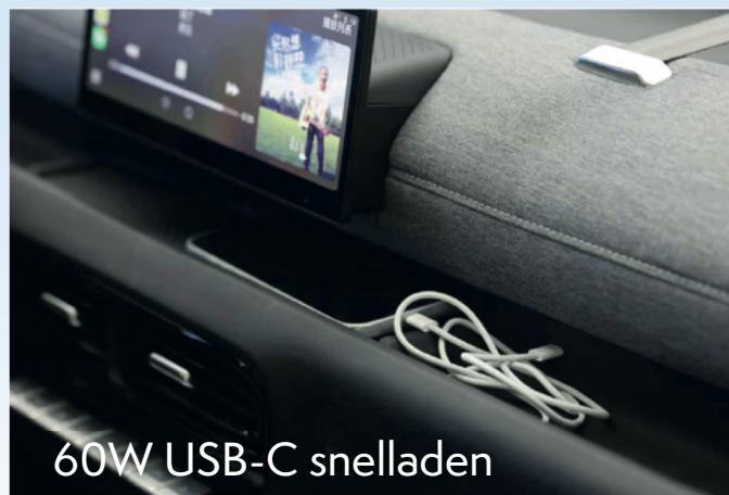
60W USB-C snelladen